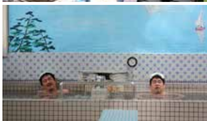
だんご DANGO 2024 日本 29分 田口智也 World Premiere