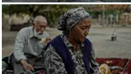
日曜日 SUNDAY 2023ウズベキスタン 97分 ショキール・コリコヴ Japan Premiere