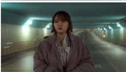
明日を夜に捨てて A Wasted Night 2023 日本 Japan 60分 張蘇銘 Japan Premiere