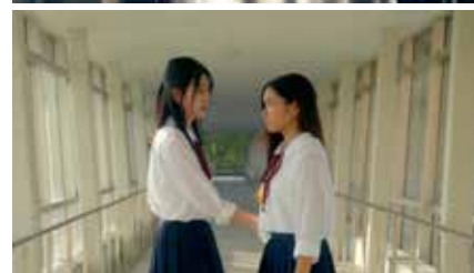
私を見て Look at Me 2023 日本 17分 山口心音 World Premiere