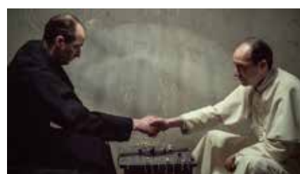
マスターゲーム 2023 ハンガリー 91分 バルナバーシュ・トート Japan Premiere ©Lenke Szilágyi