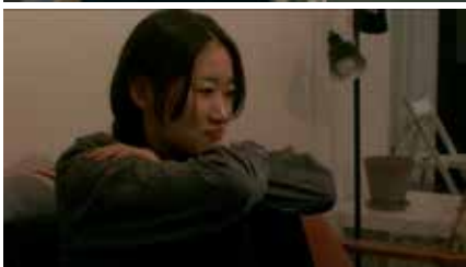
雨花蓮歌 Poems of flower rain 2024 日本 79分 朴正一 World Premiere