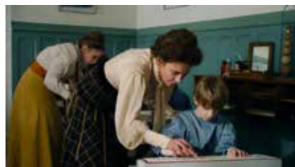
ミシェル・ゴンドリー DO IT YOURSELF! 2023 フランス 80分 フランソワ・ネメタ Japan Premiere Main photo Sub photos Director 's photo : ©François Nemeta