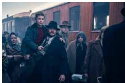
Before It Ends (英題) 2023 デンマーク 101分 アンダース・ウォルター Asian Premiere