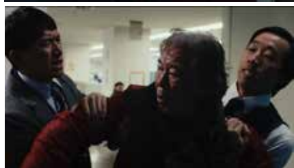
相談 LIFE IS SNOW 2024 日本、中 国 31分 張曜元 World Premiere ©東京藝術大学大学院映像研究科