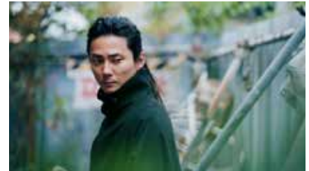
オープニング上映 / Opening Gala 初級演技レッスン 2024 日本 90 串田壮史 Takeshi KUSHIDA World Premiere "Japanese : ©2024 埼玉県 / SKIPシティ彩の 国ビジュアルプラザ 2020年『写真の女』長編部門（国際コンペ） SKIPシティアワード受賞受賞 / 2023年『マイマ ザーズアイズ』長編部門（国際コンペ）ノミネート （串田壮史監督）