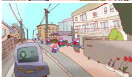
チューリップちゃん TULIP-chan 2024 日本 19分 渡辺咲樹 World Premiere