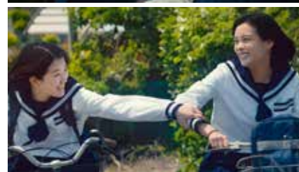
はなとこと Hana and Koto 2024日 本 42分 田之上裕美 World Premiere