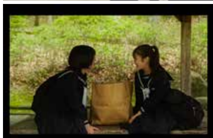
嬉々な生活 Happy life 2024 日本 91分 谷口慈彦 World Premiere