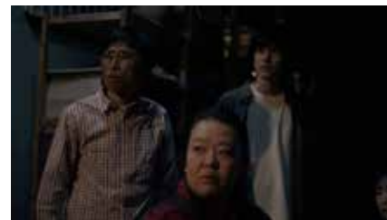
昨日の今日 The Next Day 2023 67 分 新谷寛行 World Premiere "Japanese : ©昨日の今日