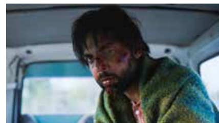
連れ去り児 (ぢ) 2023 インド 94分 カラン・テージバル Japan Premiere