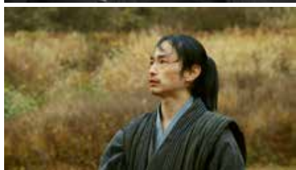
Loudness 2024 日本 22分 地曳豪 World Premiere ©2024 Loudness