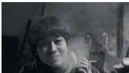
朝の火 Lost in Reminiscence 2024 日本 82分 広田智大 World Premiere