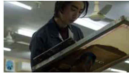
冬支度 Winter Stuff 2024 日本 74分 伊藤優気 World Premiere