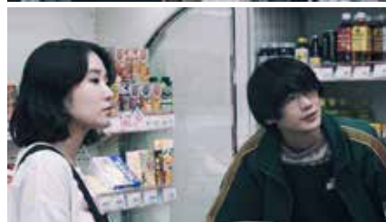
立てば転ぶ Stand Up and Roll 2024 日本 48分 細井じゅん World Premiere