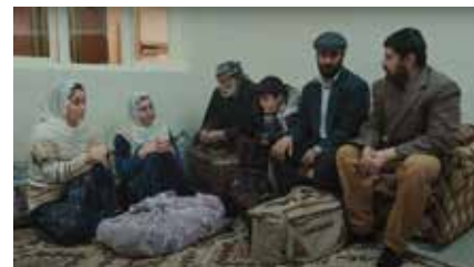
別れ 2023 トルコ 90分 ハサン・デミルタシュ Asian Premiere