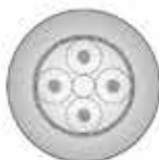
Part No.3177 (MONAURAL)

モノラル版には切断荷重 830N のステンレス・ワイヤロープを 1 本ステレオ版には 2 本(計 1,660N)を加えた吊りマイクケーブルです 広範囲に利用できるように総てカッド(4芯シールド)構造に設計されています。