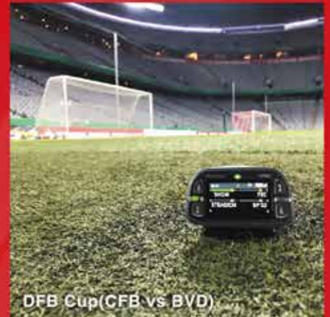
DFB Cup(CFB vs BVD)