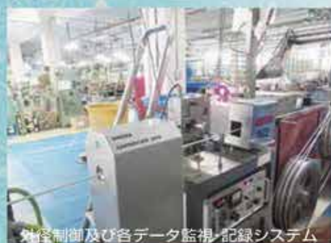
外径制御及び各データ監視・記録システム

試しに、ご希望やアイデアをメールかファックスにてお送り下さい。 的確ですばやい応答をお約束します。