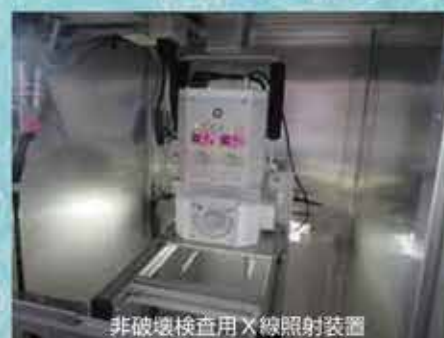
非破壊検査用 X線照射装置