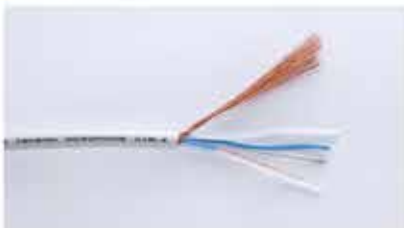
Part No.3178 (STEREO)