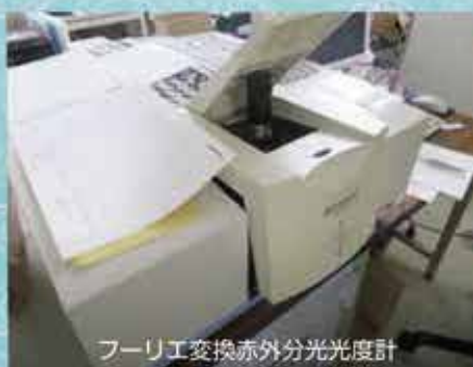
フーリエ変換赤外分光光度計