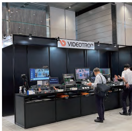
ビデオトロン 株式会社 B-34

「Edge Gateway AG20」IPカメラに限らず各センサーへの接続に対応し地域BWAのソリューションに最適な監視カメラ統合システムゲートウェイをご紹介します