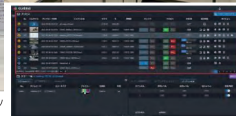
ビデオファイルコンテンツチェッカー GLADIUS の測定画面