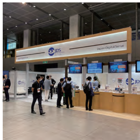
日本デジタル配信 株式会社 A-02