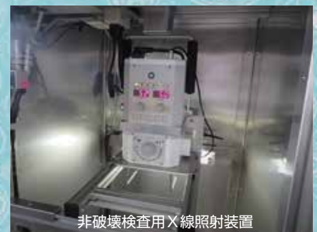
非破壊検査用X線照射装置