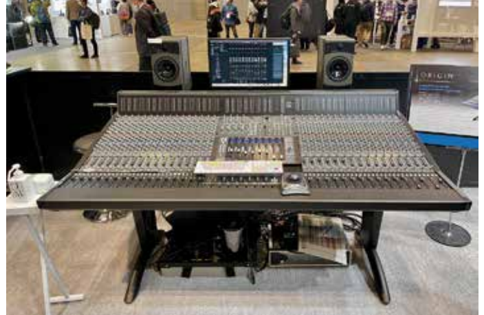
・ORIGIN - Analogue アナログインラインコンソール、センターセクションに DAW コントローラー UF8 をマウントして展示。