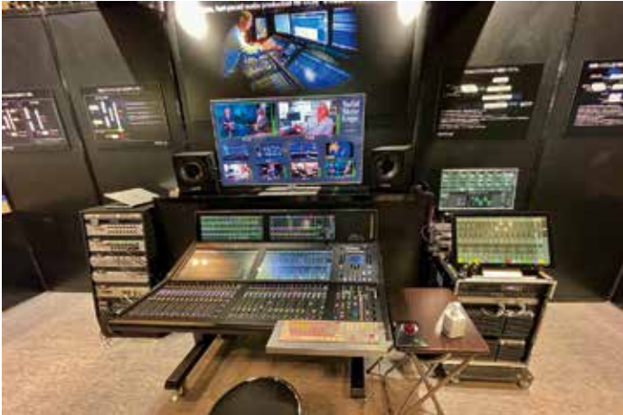
・System T S500 / S300 Dante, ST2110, AES67 などの IP 信号が扱えるネイティブ AoIP コンソール。放送、外録、ポストプロダクションなどのアプリケーションを多岐にわたりカバー。今回 S300 は ST2110 での展示。

インソフトウェアのコントローラー UC 1。デスクトップアナログミキサー SIX を展示した。