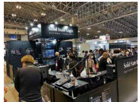
・UC 1 SSL プラグインソフトウェアのコントローラー ・SiX 2 モノ / 2 ステレオインプットのデスクトップアナログミキサー