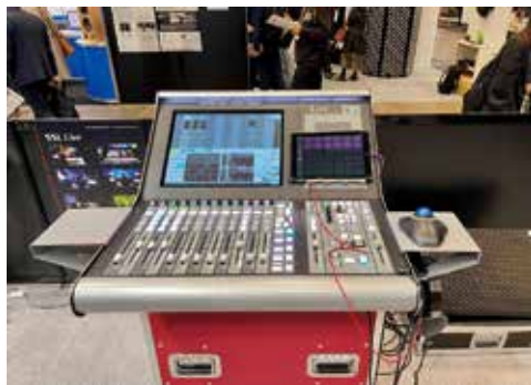
・L100 Plus - PA 用 Digital Console PA 用デジタルコンソール L100 は L100 Plus に今秋アップグレードされ、扱えるチャンネル数が増加。