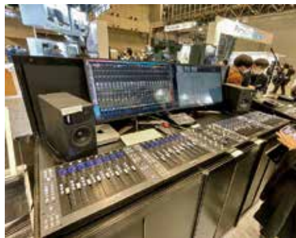
・SSL2, SSL2 + オーディオインターフェイス ・UF 8 複数台の DAW コントロールが可能な DAW コントローラー UF8。UF 8 は 4 台までカスケード接続が可能。