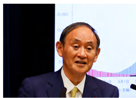
菅総理記者会見の写真

一方日本国内では、今月開催予定であったCEATECは、早々にオンラインでの開催を決定していたため、想定内ともいえる。さて、およそ1月半後となったInterBEE開催の頃には、全国的に感染者数が激減して、オン・オフ共に無事開催される事を願っている。(T.S)