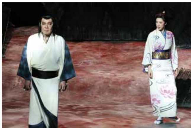
映像技術部門 グランプリ ゲキ×シネ『修羅天魔 ～罽躰城の七人 Season 極』