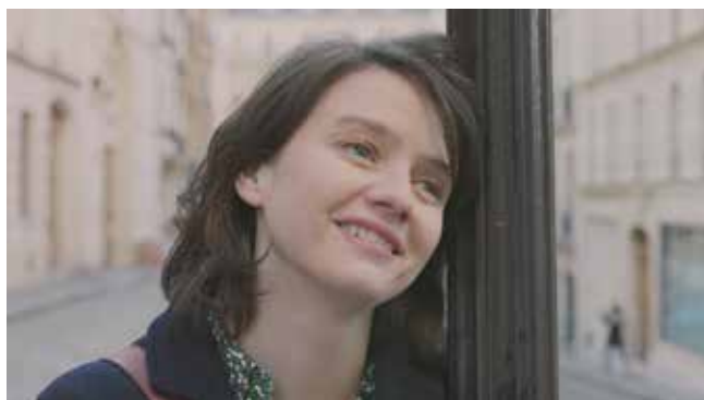
音響技術部門 グランプリ ALBION スキコン 45 周年スペシャルムービー「ずっとそばにいます」