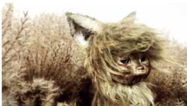
経済産業大臣賞 ごん / GON, THE LITTLE FOX