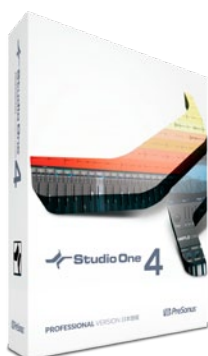
Professional 日本語版/クロスグレード日本語版

Studio One 4 は、64Bit オーディオ・エンジンとマスタリングまでを統合した最高峰 Professional 日本語版、音楽制作にフォーカスしたミドルレンジ Artist 日本語版、そして使えるフリー・バージョン Prime 日本語版の3種類で構成。さらに、各種バージョンアップ/アップグレード版、Professional へロープライスで乗り換えることができるクロスグレード版、Studio One とベストマッチな楽譜作成ソフトウェア Notion とのバンドル版もラインアップしています。