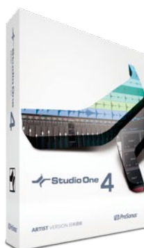
Artist 日本語版 (PreSonus ハードにもバンドル)

64Bit オーディオ・エンジン、コード・トラックとハーモニー編集、ソング・データのインポート、スクラッチパッド、統合的なマスタリング機能、VST/AU/ReWire 対応、QuickTime ビデオ対応、AAF 対応、Melodyne 統合、Notion との連携、エフェクト・プラグイン 41 種 / パーチャル・インストゥルメント 5 種収録 / Note FX 4 種収録等