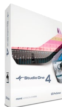
Prime 日本語版 (6月～7月提供開始予定)

パターンベースのアレンジ機能、フォルダー・トラック、トランジェント検出、グルーブ抽出 / クオンタイズ、イベントベースのエフェクト、マクロ・ツールバー、Melodyne 統合、Notion との連携、エフェクト・プラグイン 30 種 / パーチャル・インストゥルメント 5 種収録 / Note FX 1 種収録等