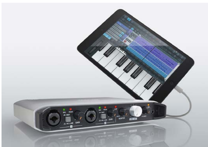
▲『iXR』と iPad mini の接続イメージ

ティアック株式会社(本社:東京都多摩市、代表取締役社長:英 裕治)はオーディオ/MIDI インターフェース『iXR』専用ソフトウェア Settings Panel Version 2.0 を TASCAM ホームページにて無償ダウンロード提供いたします。