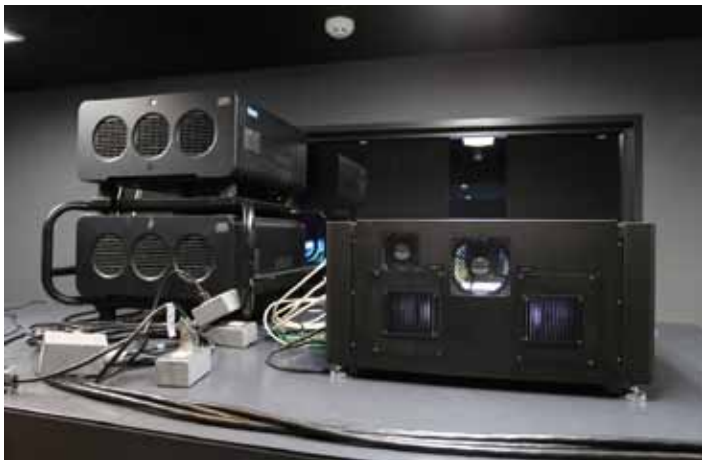
8K/4K プロジェクタ DLA-VS4800 (JVC ケンウッド) と HD プロジェクタ TH-DW10000 (パナソニック)