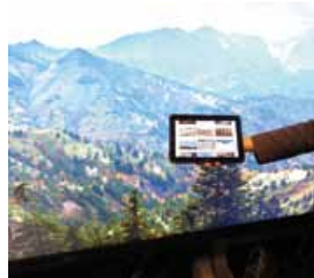
タブレット端末を用いて客席からでもコンテンツを選択できる