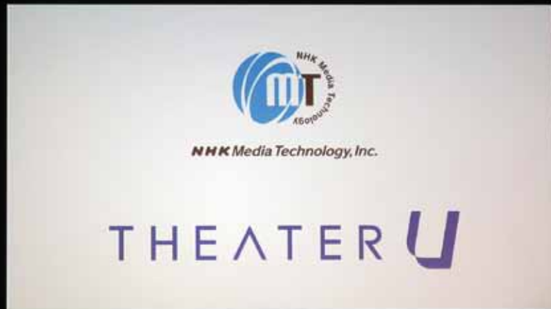
150 インチのホワイトスクリーン (8K /4K/ HD)、シルバースクリーンに交換する事で 3D 上映も可能となる