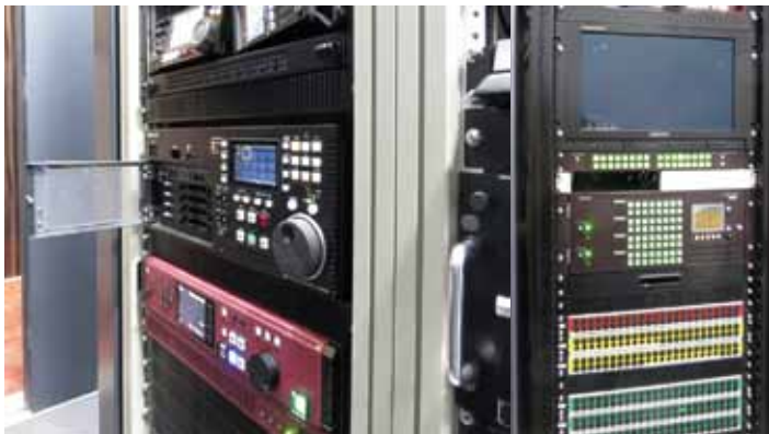
SHV レコーダ: AJ-ZS0500 (パナソニック) SSD レコーダ: HDR-7512-C (アストロデザイン)