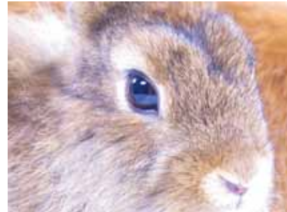
画面に近づいての視聴でも毛並みまでクッキリ