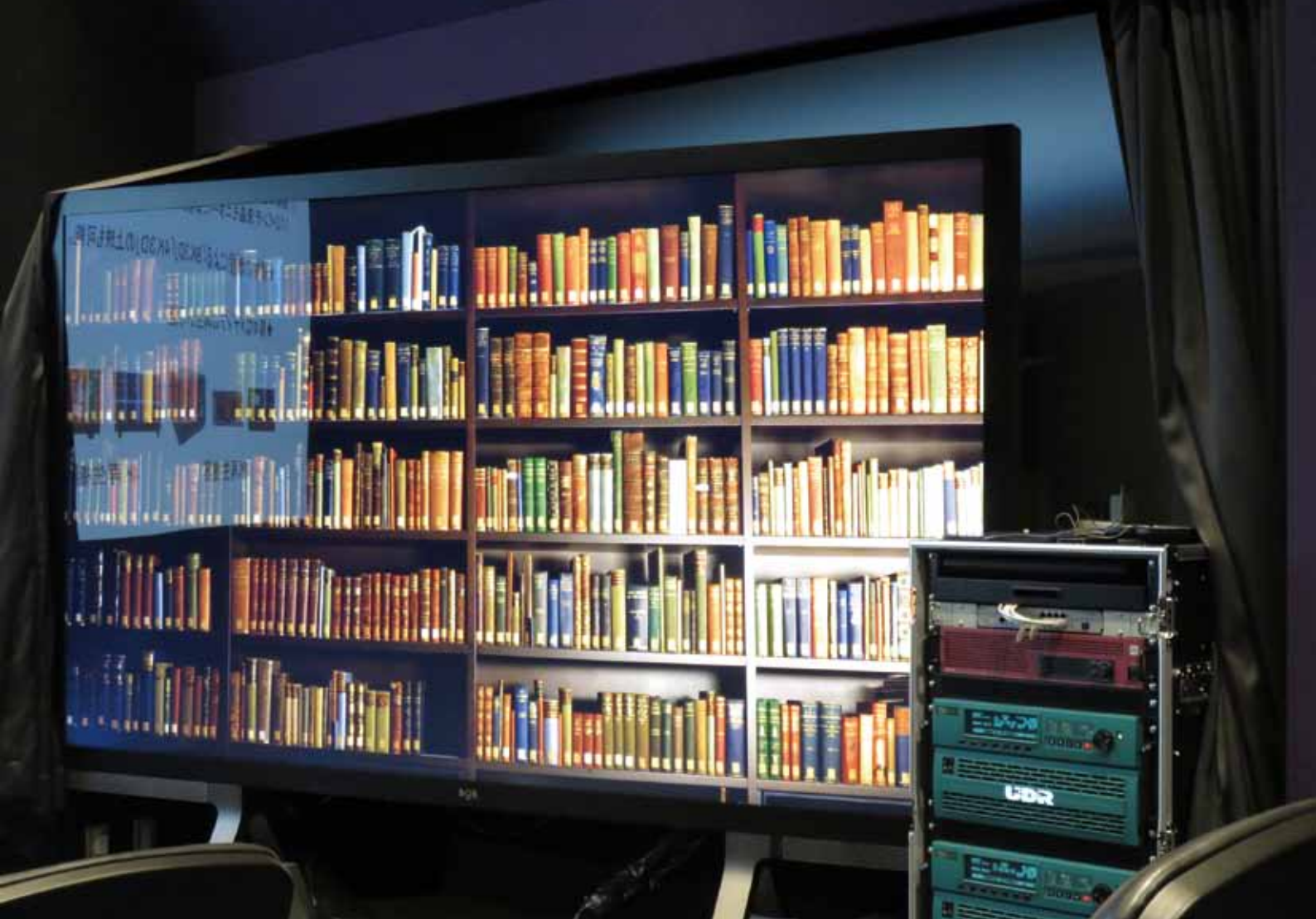
8K 110 インチ直視型モニター (BOE)、非圧縮ディスクレコーダ UDR-40S、2 式 (計測技術研究所)