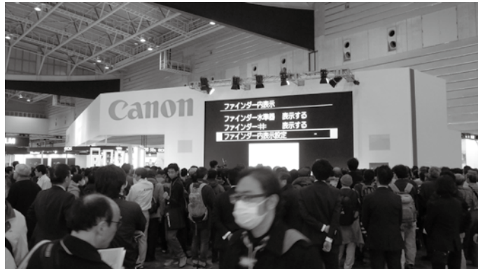
優秀出展社賞、金賞は、キヤノン株式会社/キヤノンマーケティングジャパン株式会社