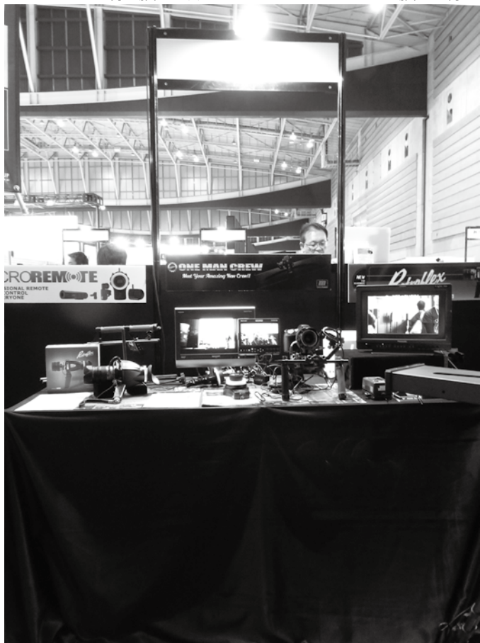
株式会社ライトアップ redrockmicro redrockmicro社のワイヤレスフォーカスシステムのマイクロリモートやパラボリックレールのワンマンクルーを中心に、カメラ、モニターなどを組み合わせた展示。