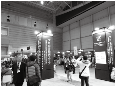
プロ向け動画エリア入り口