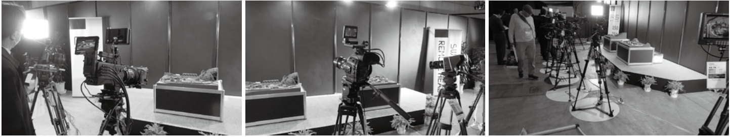
エリアの奥には動画カメラが並ぶ