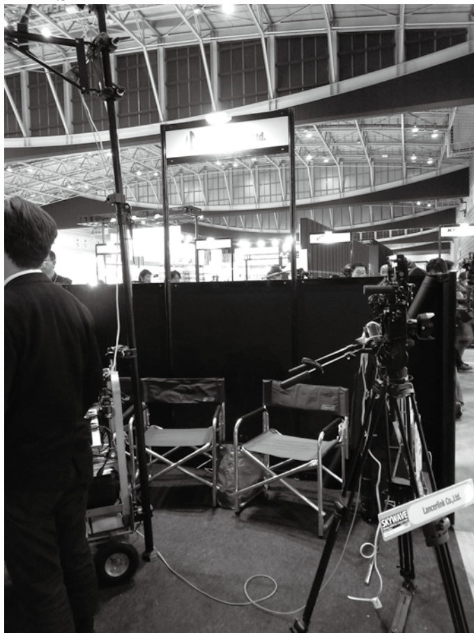
ランサーリンク株式会社 長距離無線伝送の設置方法や外部アンテナの使用方法などを実際に展示。また、4K2K @ 60Hzに対応した製品の展示。