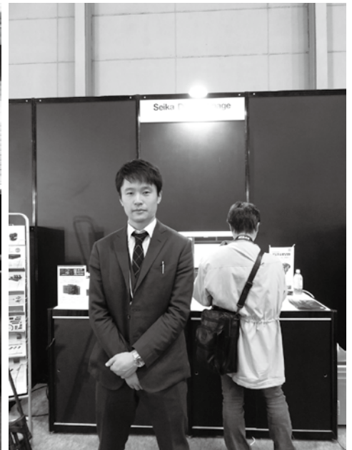
西華デジタルイメージ株式会社 RED Digital Cinema 社 製 EPIC Dragon / Seculine 社製 Cineroid EVF4RVW、LED 照明約 1940 万画素の高解像度、16.5 ストップのハイダイナミックレンジの RAW データ収録可能な EPIC Dragon を Cineroid 製ビューファア、LED 照明と共に展示。