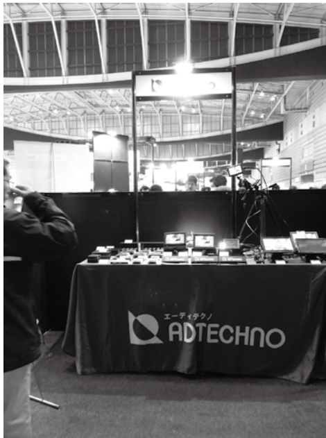
株式会社エーディテクノ ADTECHNO / DIGITAL FORECAST 動画撮影時のピント合わせや構図確認等に便利なフィールドモニターを展示。軽量で持ち運びし易いので様々な場所で活躍する。また DigitalForecast 社コンバーターや HDBaseT 製品も展示。