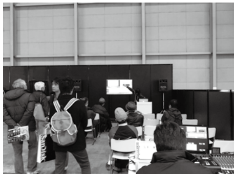
動画エリア内でもセミナーは行われた