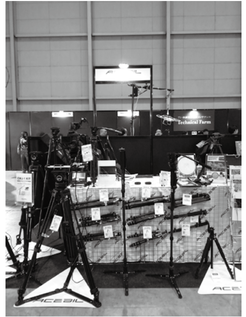
ACEBIL JAPAN 株式会社 デジタル一眼、小型ビデオカメラ用機材の軽量ジブ CMJ-1・コンパクトスライダー S15+PURS を中心に三脚、アクセサリを展示。