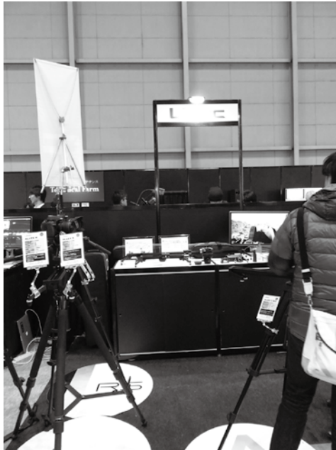
平和精機工業株式会社 Libec 国内メーカー初となるスライダー三脚システム「ALLEX」を展示。滑らかで粘りのあるスライダーショットを体感できる。また、スタジオ仕様の三脚やジブアームなどで幅広い撮影シーンへ提案。