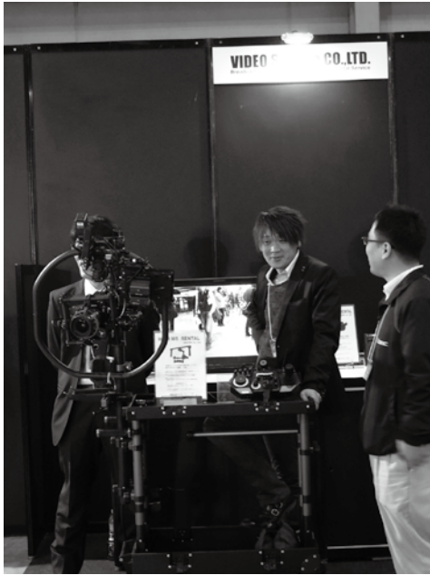
株式会社ビデオサービス SONY / Canon / Panasonic 撮影機材の一部を展示。