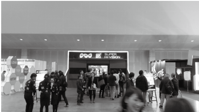
NHKは、85インチのディスプレイで8Kのデモ映像を流していた。